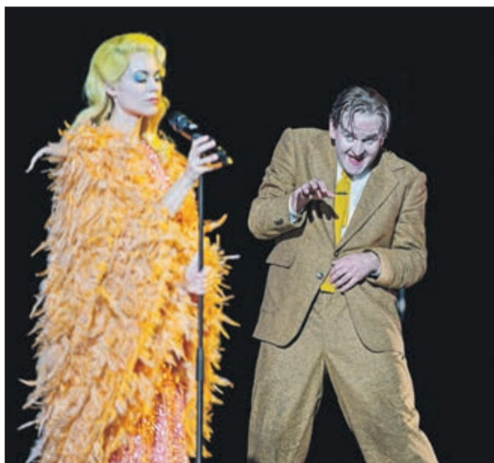
Zurück auf die Bühne: Das Theater Freiburg zeigt unter anderem „Mr. Emmet Takes a Walk“ per Stream.

■ Alle Streams, alle Infos unter: www.theater.freiburg.de/streaming ■ Nach den Premieren findet direkt im Anschluss an den jeweiligen Stream ein Nachgespräch per Zoom statt. Die Zuschauerinnen und Zuschauer erhalten mit ihren Zugangsdaten zum Streaming zugleich auch den entsprechenden Zoom-Link.