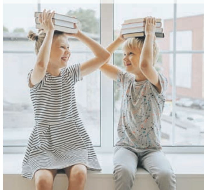
Wann beginnt die Schule wieder?

Corona-Maßnahmen: Friseure, Kindergärten, Einzelhandel