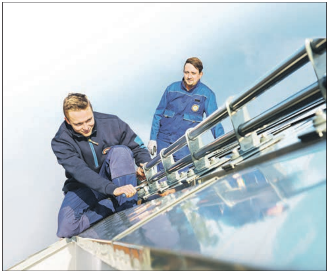
Ob Regenrinne, Fassadenverkleidung oder Solarthermie-System: Klempner sind die Metall-Spezialisten im Baugewerbe.

Profis für Metallbearbeitung an Dach und Fassade