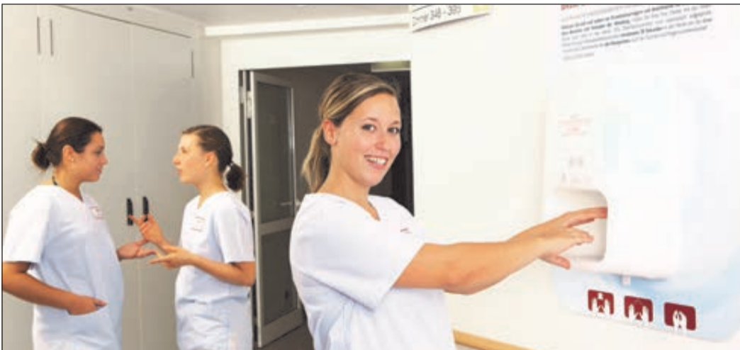
Der Auszeichnung für das Ev. Diakoniekrankenhaus voraus ging die Erfassung und Bewertung eines Bündels von Maßnahmen wie beispielweise die Verteilung von Desinfektionsmittelpendern und der Verbrauch an Desinfektionsmitteln.

Ev. Diakoniekrankenhaus erneut ausgezeichnet