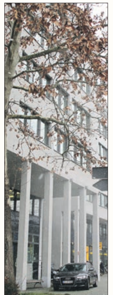
Das Arbeitsgericht in der Habsburgerstraße 127.