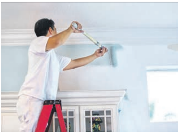
Gesunder Anstrich für ein besseres Wohnklima: Versierte Fachbetriebe haben das nötige Know-how, um bei Renovierungsarbeiten ökologisch einwandfreie Materialien einzusetzen.

keit der verwendeten Baustoffe. in der Raumluft, die manche Bauder Wohnmaterialien absondern. Um versteckte Risiken auszuschließen, können Öko-Labels eine verlässliche Orientierung bieten. Mit