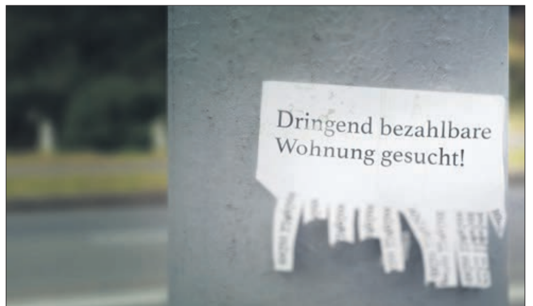
Ein inzwischen typisches Bild.