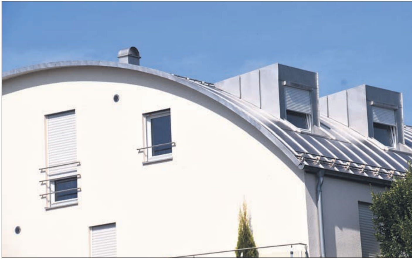
Das Runddach oder Tonnendach – im Bereich von Wohnimmobilien immer noch ein Exot.

Zu den „Unterarten“ des Steildachs gehört auch das Walmdach, erklärt Schendel. Hier sind an den Giebelseiten ebenfalls steil abfallende Dachflächen vorhanden. Eine weitere Art des Steildachs ist das Zelt-dach, das oft bei Häusern im „toskanischen Stil“ verwirklicht wird. Eine andere Steildachform, die sich besonders in der Zeit der Industrialisierung zur Nutzung von Dachräumen in