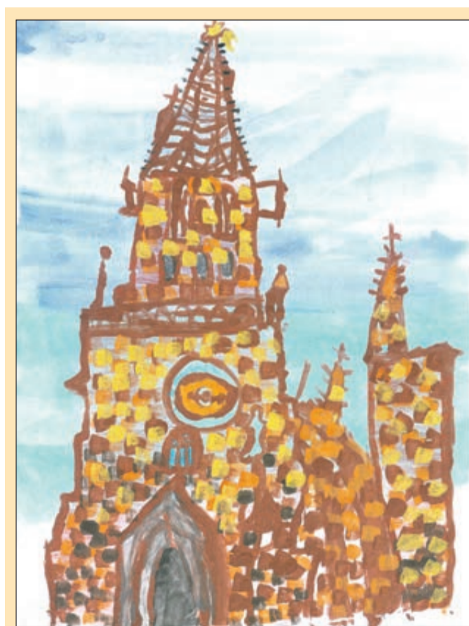
Mehr als 60 Kinder malen das Münster

(sk). Einen ordnungsgemäß geparkten Pkw beschädigt hat ein unbekannter Verkehrsteilnehmer am Freitag (5. Februar) gegen 14.05 Uhr auf einem Supermarktplatz (Real) in der Gundelfinger Straße in Freiburg. Dabei wurde dem Fahrzeug des Geschädigten die Frontstoßstange abgefahren, sodass diese halbseitig herunterhing. Der entstandene Sachschaden bewegt sich vermutlich im mittleren vierstelligen Bereich. Der Unfallursacher entfernte sich von der Unfallörtlichkeit, ohne sich um den entstandenen Schaden zu kümmern. Da der Parkplatz zum Unfallzeitpunkt stark frequentiert war und sich der Unfall nahe des Eingangsbereiches ereignete, ist es wahrscheinlich, dass Zeugen den Vorfall beobachtet haben. Die Polizei bittet um Hinweise unter Telefon 0761/882 - 3100.