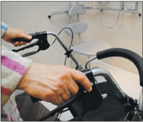
Barrierefreie Dusche: Mit Blick auf den demografischen Wandel fordert die IG BAU mehr Anstrengungen beim altersgerechten Bauen und Sanieren.

jetzt durch die Corona-Pandemie verschärft, weil gerade ältere Menschen einen Großteil des Tages zuhause verbringen müssten. Die staatliche Kreditanstalt für Wiederaufbau (KfW) bietet mit ihrem Programm „Altersgerecht Umbauen“ zwar Zuschüsse und Kredite. Das Fördervolumen von 150 Millionen Euro in diesem Jahr reiche aber nicht aus, kritisiert die IG