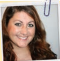
Von Sandra Tieso