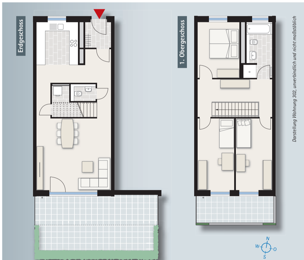
Darstellung Wohnung 302, unverbindlich und nicht maßstäblich

Der 1. Schritt beim Verkauf ist die Festlegung des Immobilienwertes. Für Laien ist das schwer. Verkäufer wollen hierbei keine Fehler machen, schließlich geht es um sehr viel Geld.