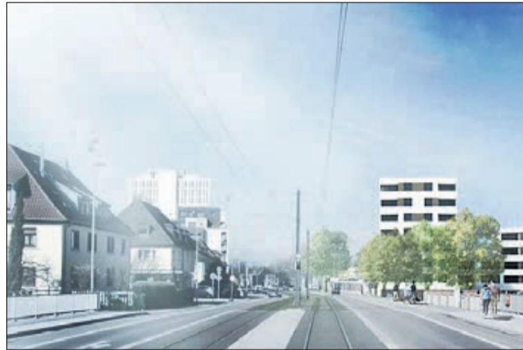
Wohnbebauung Breisacher Hof.

Zu den 3,75 Mio. Euro von Bund und Land kommt noch der städtische Eigenanteil in Höhe von 2,5 Mio. Euro hinzu. Damit können insgesamt 6,25 Millionen Euro in die Sanierung von bezahlbarem Wohnbau und wichtiger Infrastruktur fließen.