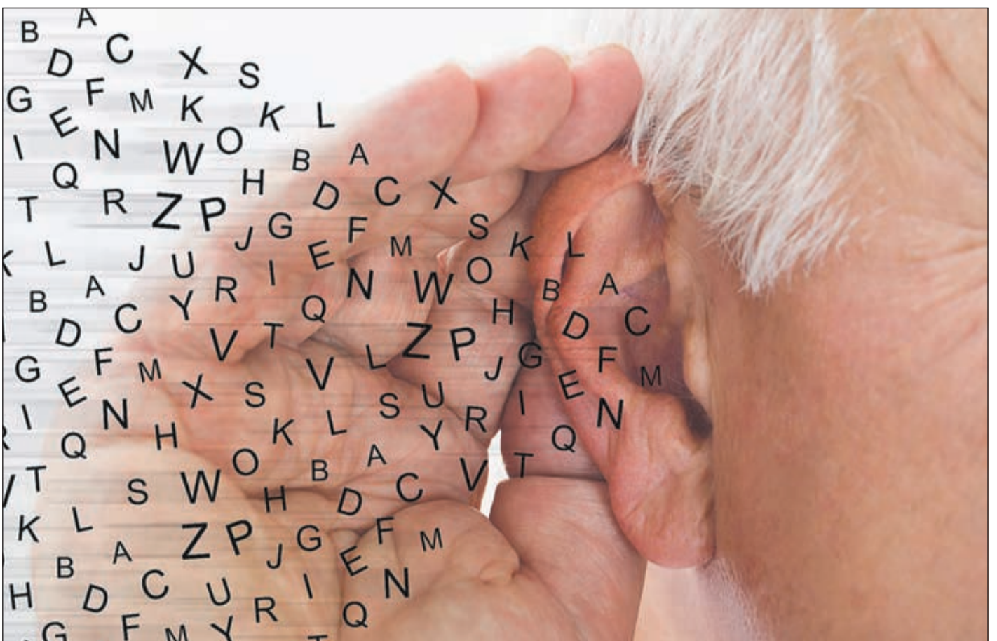
Neben vermehrten Nachfragen sind bei Menschen mit Hörproblemen auch häufig Radio oder Fernseher zu laut eingestellt.

Ab wann ein Hörgerät sinnvoll ist – Mund-Nasen-Schutz als Herausforderung