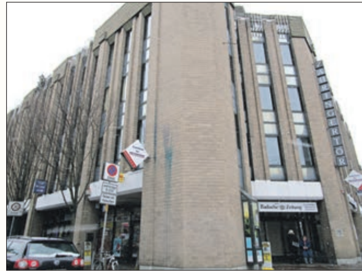
Das Sozialgericht in der Habsburgerstraße 127.