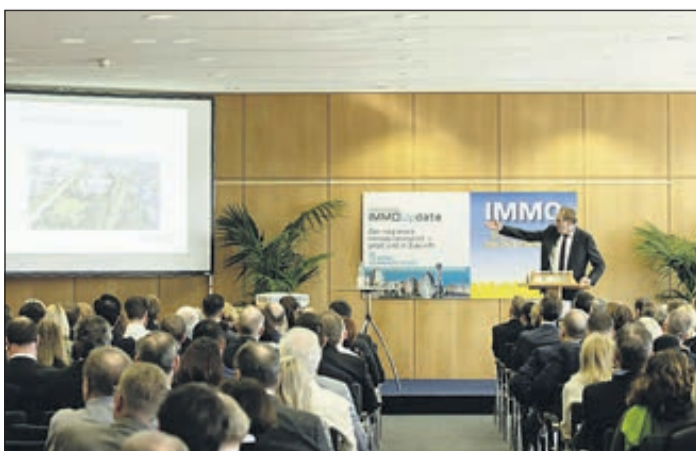
2. Freiburger IMMO-Update.

Um allen Beteiligten eine gewisse Planungssicherheit zu bieten, hat sich die Messe Freiburg als Veranstalterin dazu entschlossen, die IMMO-Messe auf den 24. + 25. April 2021 sowie den einleitenden Fachkongress 3. Freiburger IMMO-Update auf den 23. April 2021 zu verlegen.