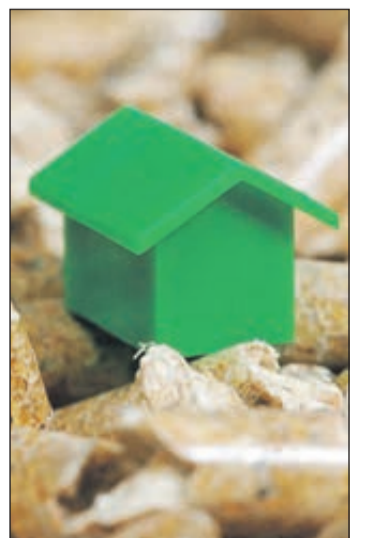
Eigenheimbesitzer, die ihren alten Heizkessel gegen ein modernes Holzpelletsystem austauschen, haben Anspruch auf hohe staatliche Förderungen.

nierungsfahrplan (iSNF) gibt es ebenfalls 5 Prozentpunkte zusätzlich. Außerdem wird die Höchstgrenze für die förderfähigen Kosten bei Wohngebäuden auf 60.000 Euro je Wohneinheit angehoben. Wer seine alte Heizung gegen ein modernes System auf Basis erneuerbarer Energien austauschen und künftig mit Holzpellets heizen möchte, sollte das Gespräch mit einem Fachbetrieb vor Ort suchen. Denn neben den Bundesprogrammen gibt es auch noch eine Vielzahl regionaler Förderprogramme. Eine ausführliche Übersicht und die Kontaktdaten von Ansprechpartnern vor Ort finden sich beim Deutschen Pelletinstitut unter www.pelletfachbetrieb.de .