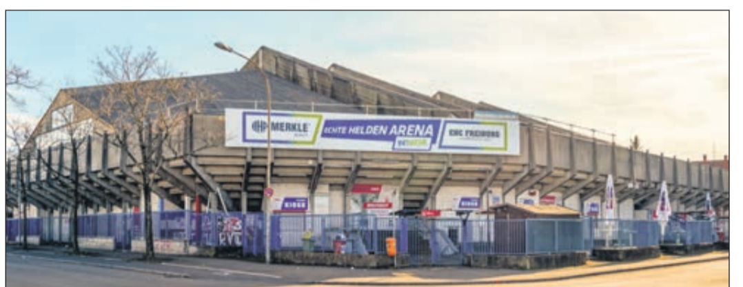
„Echte-Helden-Arena“: Die Betriebserlaubnis läuft 2024 aus – und dann?